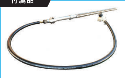
日本製レギュレーター付きパイプラインバーナー